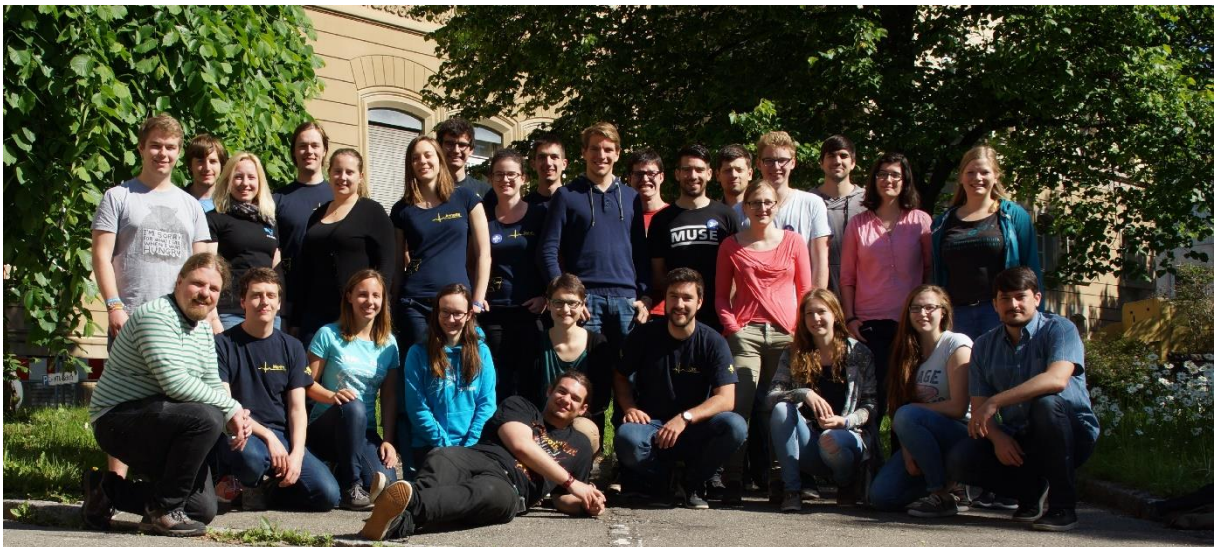
Teilnehmer des Zwischenkonvents am 21. Mai 2017 in Tübingen

Ausblick: Die KOMET 2017 findet in Mannheim statt. Ein nächster Zwischenkonvent 2018 ist in Karlsruhe geplant.